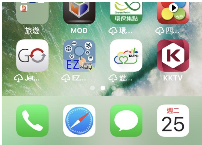
110. 5. 25張貼海報