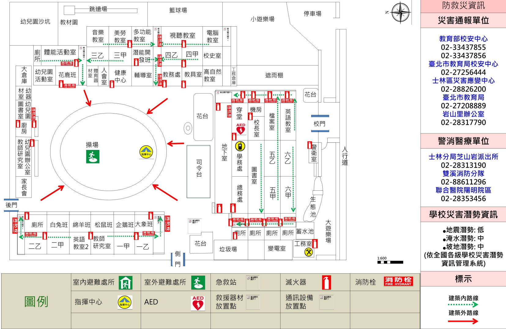
臺北市士林區雨聲國小一校園防災地圖(地震災害) 經度:東經121度32分07.0秒 緯度:北緯25度06分09.6秒 111.08 總務處製