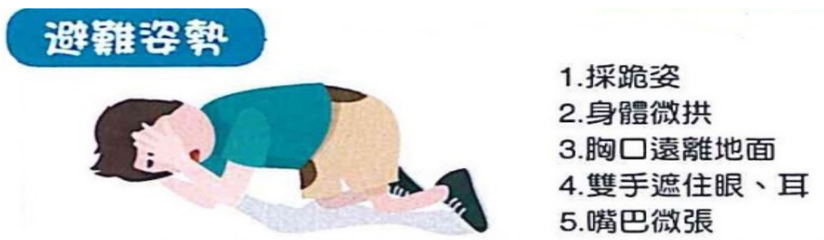
附圖：防空避難姿勢