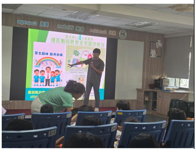
期初安全常規宣導