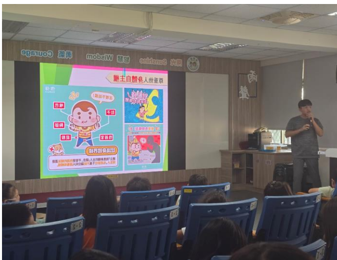
期初安全常規宣導